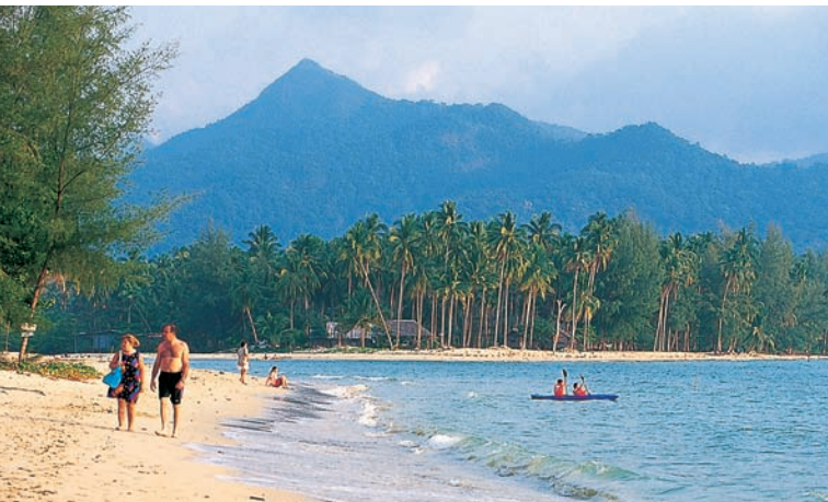
Хат Кхлонг Пхрао

от Ао Кхлонг Пхрао. Самый красивый уголок водопада на верхнем его уровне — здесь можно искупаться и отдохнуть.