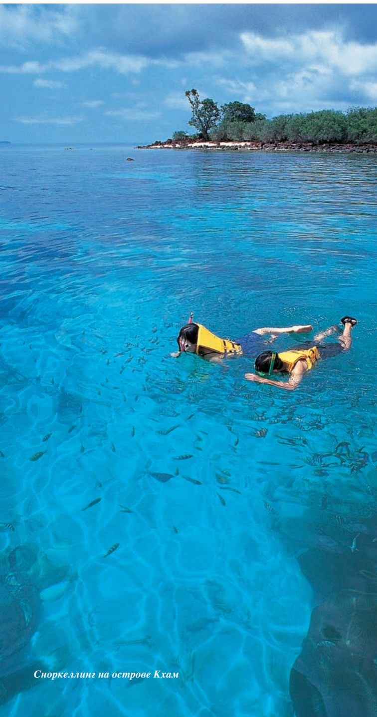
Снорклинг на острове Кхам