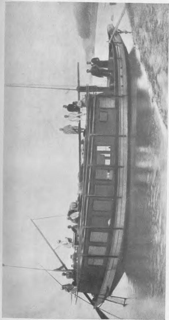
Лодка Р. Тагора на реке Падме Здесь были написаны стихи, вошедшие в книгу «Сбор урожая» («Чойгали»).