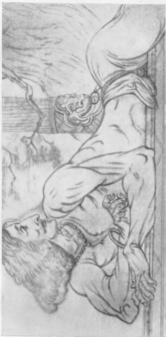
Арджуна — рисунок индийского художника Нолдолала Бошу