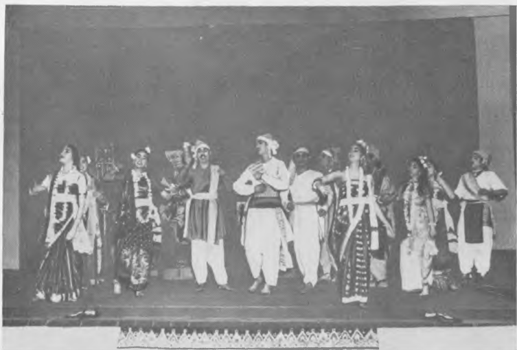
Сцена из драмы Р. Тагора «Читрангода»