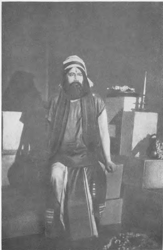
Р. Тагор в роли Джойшингхо (драма «Жертвоприношение»)