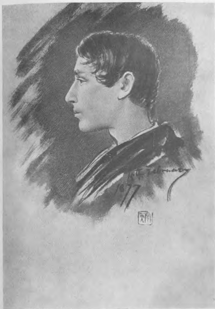
Р. Тагор (1877)

Портрет, выполненный братом Р. Тагора Джотириन्द्रонатхом Тагором