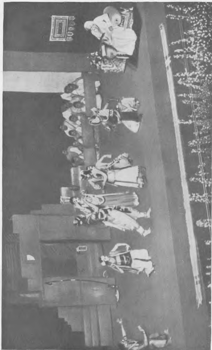
Сцена из музыкальной драмы «Читрангода»