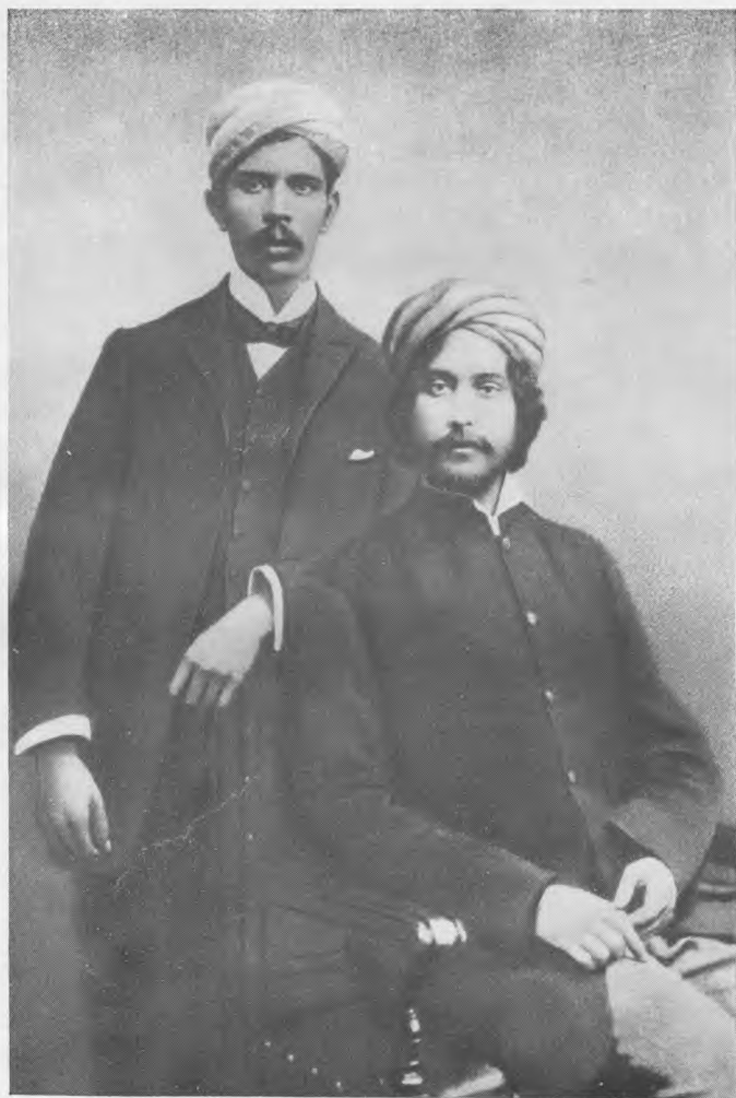
Рабиндранат Тагор со своим другом Локендронатхом Палитом (1880)