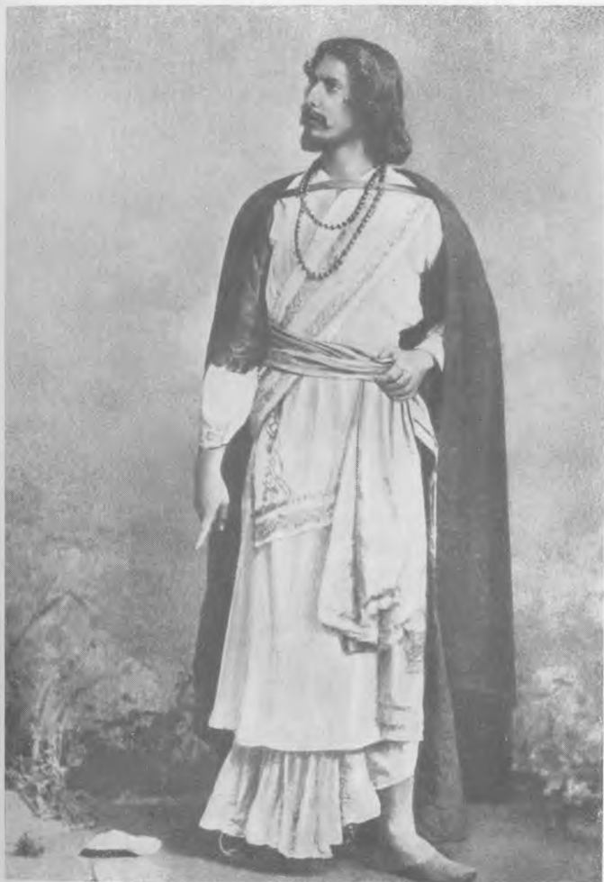
Р. Тагор в роли Вальмики (драма «Гений Вальмики»)