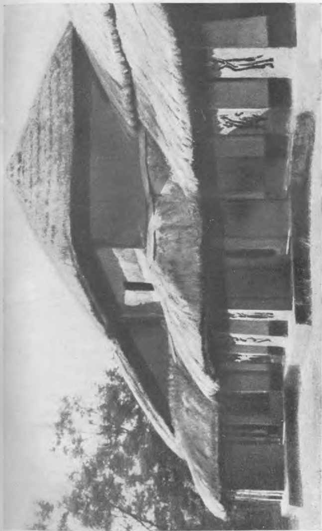
Шантиникетон — школа искусств