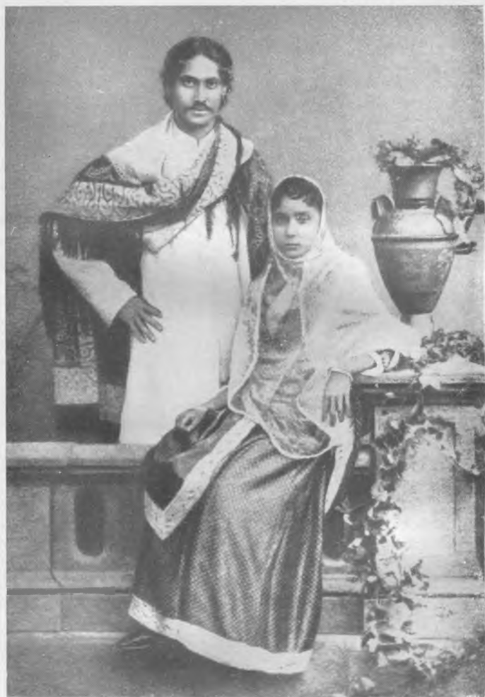
Р. Тагор и его жена