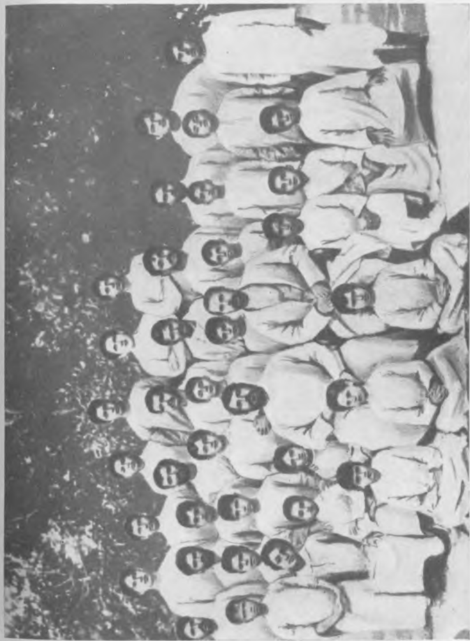
Р. Тагор среди учащихся и преподавателей Шантиникетона (1904)