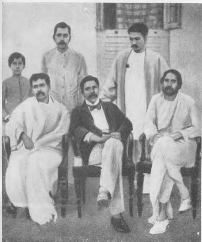
Р. Тагор с друзьями и сыном (1904)