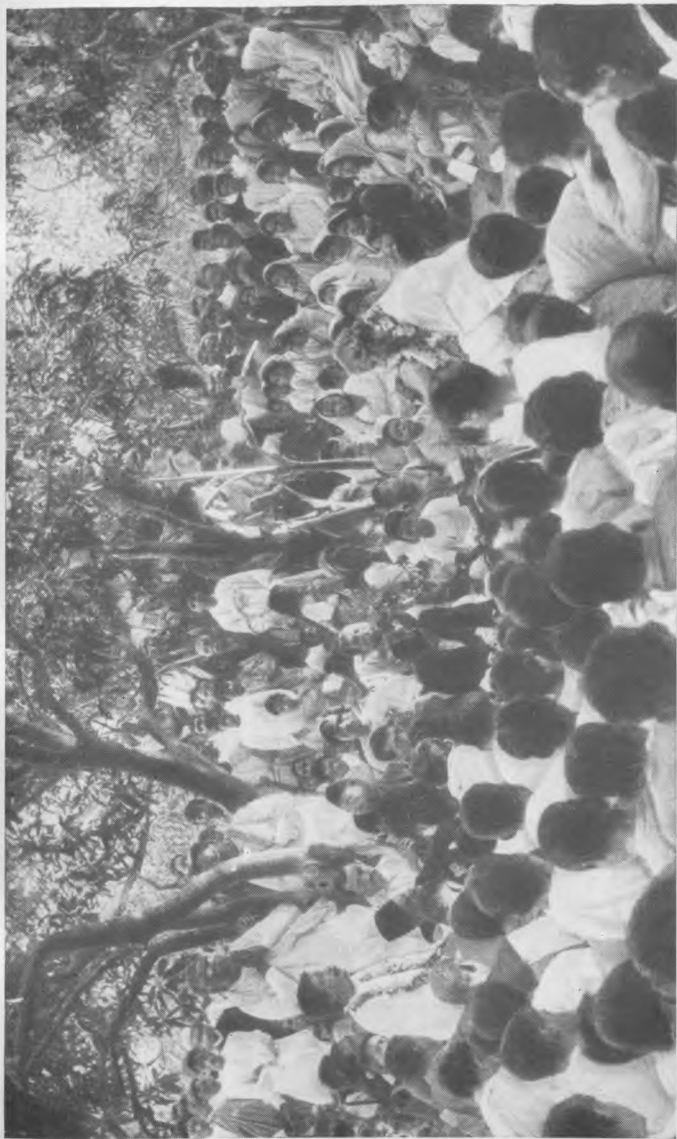
Собравшиеся поздравляют Р. Тагора с получением Нобелевской премии (Ноябрь 1913)