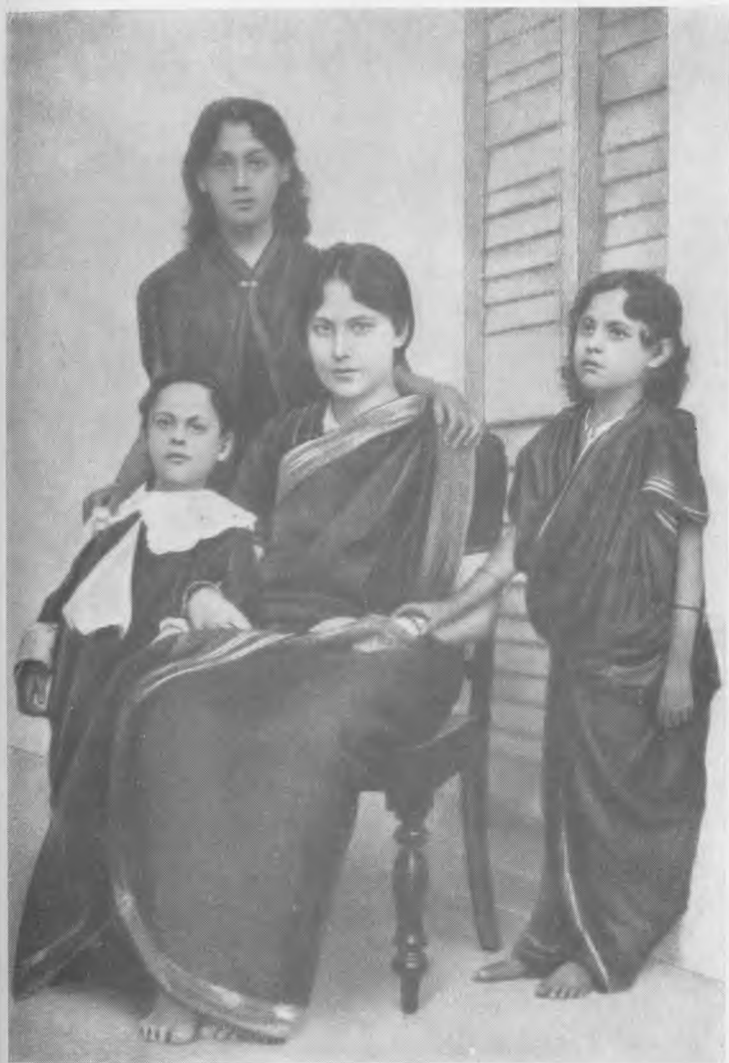
Дети Р. Тагора