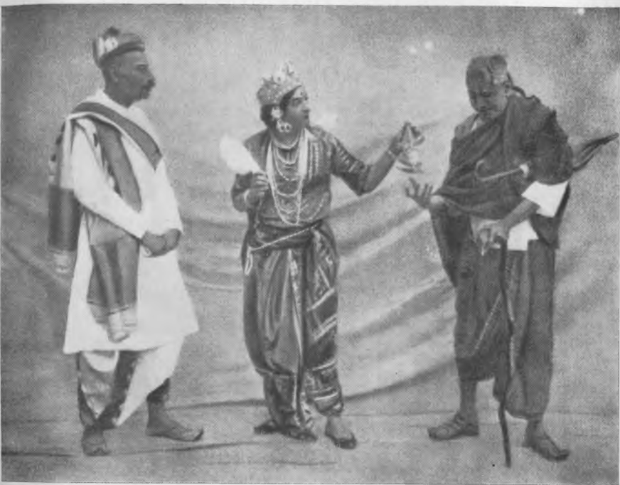
Сцена из пьесы «Торжество весны»