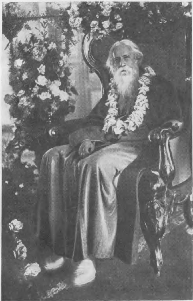
Р. Тагор в день своего рождения в Тегеране (1932)