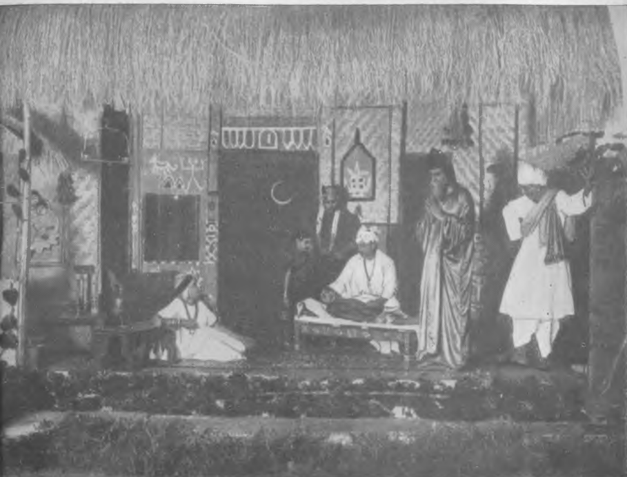
Сцена из пьесы «Почта»