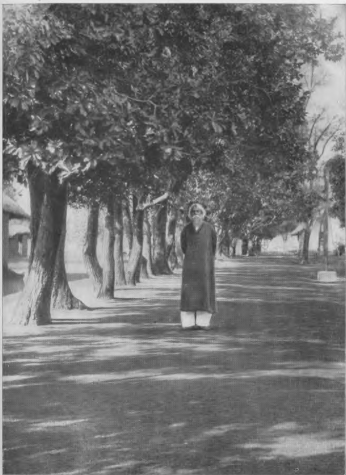
Р. Тагор в Шантиникетоне, в своей любимой шаловой аллее, увековеченной им во многих стихах