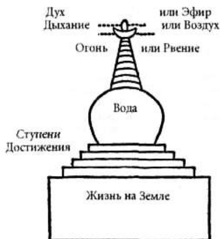
Символика тибетских чортегов.

Чортен — это полный символ нашей веры. Мы рождаемся на земле. В течение всей жизни мы взбираемся или пытаемся взобраться как можно выше по Ступеням Достижения. Наконец, испустив последний вздох, мы входим в царство Эфира, или Духа. Затем вновь рождаемся для получения нового урока. Колесо Жизни символизирует этот бесконечный цикл: рождение — жизнь — смерть — дух — рождение и т. д.