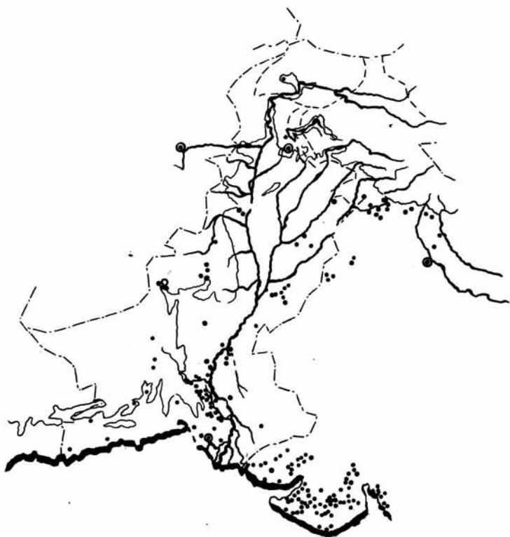
Рис. 1. Карта протоиндийской цивилизации.

Поселения хараппской культуры, обнаруженные вначале лишь в долине Инда, теперь известны на огромной территории, которая занимает площадь более 1100 км