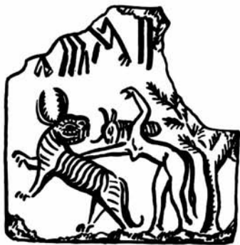
Рис. 4. Богиня с тигром.

ния и знание ритуально-мифологических тонкостей были уделом и прерогативой узкого круга образованного жречества. Основная же масса адептов оставалась им чужда, подходя к религии преимущественно с утилитарными целями и имея во главе угла помощь в повседневных делах и удовлетворение определенных эстетических и эмоциональных запросов. Как сможем мы узнать об этом?